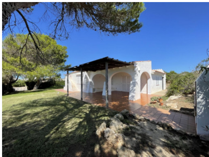
Ansicht auf das Haus