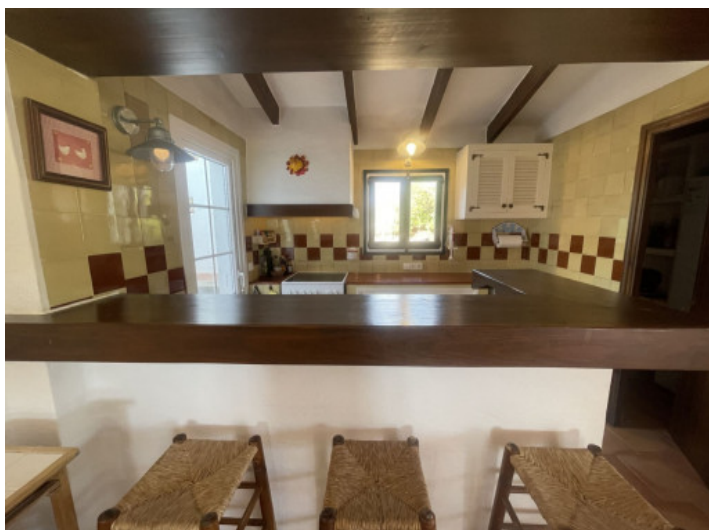
Halb offene Küche