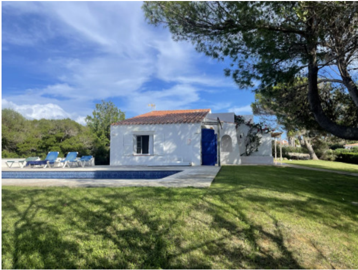
Ansicht auf das Chalet