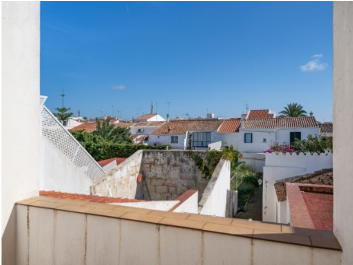
Ausblick auf die Umgebung